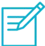
Inventar un cuento

También pueden utilizar trozos de cartulina fina para hacer los ojos y la boca de las hojas más grandes.