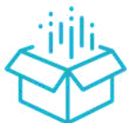
La caja de disfraces

En una caja de cartón o un balde, mete todo lo que se pueda usar para hacer pequeños juegos de rol. Una vieja peluca de carnaval, una capa, una camisa, un sombrero, un par de gafas de plástico... Cualquier accesorio para disfrazarse será útil. Una vez disfrazados, los niños y tú pueden inventar historias e interpretar un personaje. ¿Qué mejor juego para un niño que ser el protagonista de su propia historia? Mejor aún, si la historia inventada se refiere a los personajes de la vida cotidiana, puede convertirse en una oportunidad estupenda de imitar a los adultos.