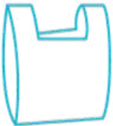
¿Suave o rugoso?

Una simple caja puede ser un fabuloso coche para tu hijo. Potencia su imaginación con este divertido juego.