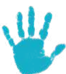
Pintura de dedos

Mejor que disfraces ya hechos, les gustará ponerse prendas nuestras (pasadas de moda o viejas), accesorios variados (bolsos, gorros, guantes y hasta zapatos) y mucha, mucha bisutería.